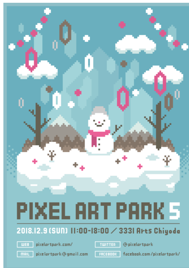
メイングラフィック

「Pixel Art Park(ピクセルアートパーク)」は、ドット絵好きによるドット絵オンリーイベントです。ドット絵の魅力や可能性を国内外へ発信することがコンセプトになっています。