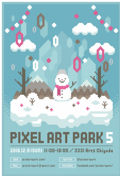
メイングラフィック